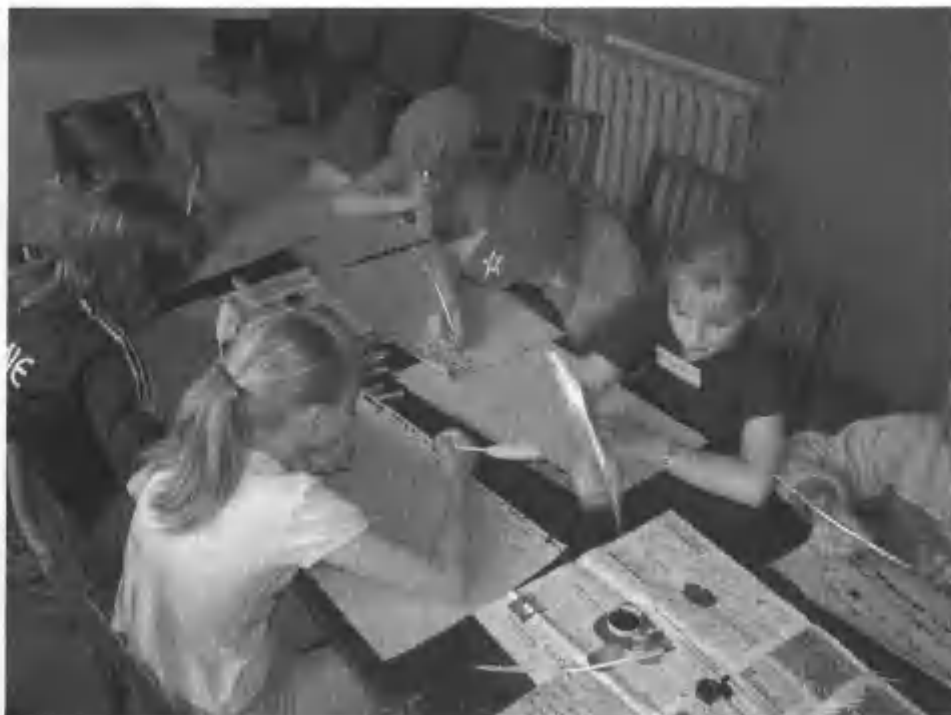
7. Dzieci w trakcie warsztatów archeologiczno-historycznych w 2005 r.