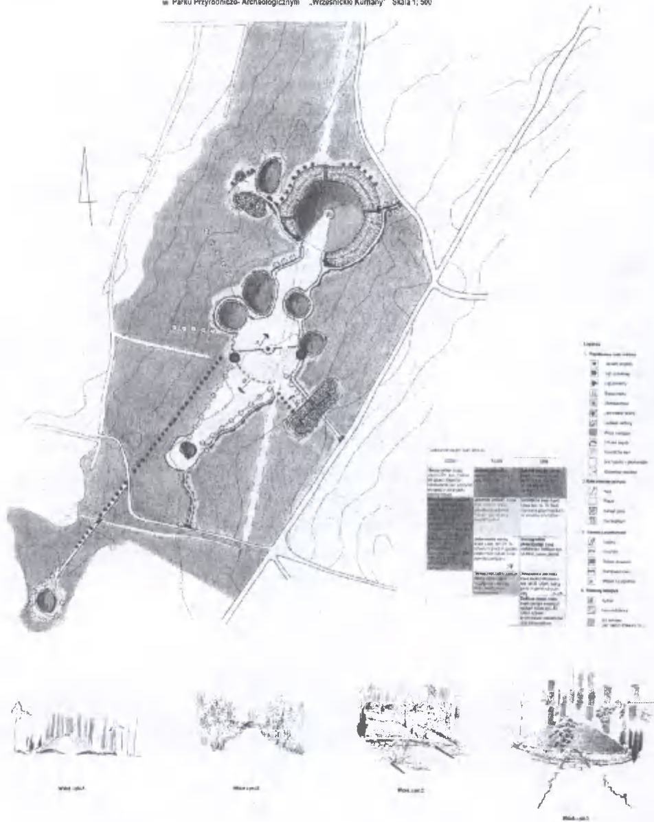
8. Projekt zagospodarowania cmentarzyska kurhanowego (Wrześnica, stan. 16) wg pomysłu Adama Kijowskiego

w Parku Przyrodniczo-Archaologicznym „Wrześnickie Kurhany” Skala 1: 500