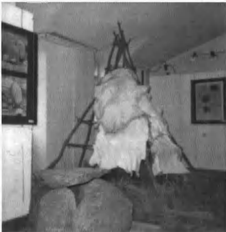
2. Fragment wystawy „Zanim powstało Sławno”; Archiwum Fundacji „Dziedzictwo”

tury (szalaś z I tysiąclecia p.n.e., chata z początków naszej ery). Wystawa spotkała się ze sporym lokalnym zainteresowaniem i stała się istotnym potwierdzeniem ważności związku archeologów z lokalnymi społecznościami.