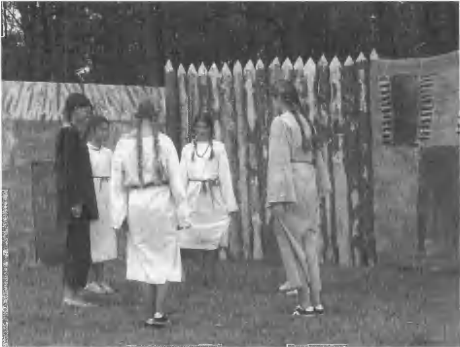
6. Uczestnicy warsztatów dla dzieci i młodzieży prezentują swoje umiejętności w trakcie festynu „Sobota na grodzisku” w 2008 r.

Festyn stwarzał okazję do zabawy (i nauki) przez chwilę i sam w sobie nie za bardzo angażował lokalną społeczność. Trudno było oczekiwać, by dorośli poważnie i na dłużej włączali się w aktywność związaną z popularyzacją wiedzy. Zatem dzieci stały się celem kolejnych działań. W 2002 roku, we współpracy ze Sławieńskim Domem Kultury, podjęto inicjatywę organizacji kilkudniowych warsztatów archeologiczno-historycznych, które pozwoliłyby dzieciom i młodzieży przygotować się do festynu. Ważne były tu dwa cele: ułatwienie przyswajania wiedzy prezentowanej w trakcie festynu oraz przygotowanie dzieci i młodzieży do prezentowania w trakcie festynu własnej twórczości, nowo nabytych umiejętności – pokazania się własnej społeczności i gościom spoza regionu. Ideą było też włączenie, poprzez dzieci i młodzież, lokalnej społeczności do organizacji i odpowiedzialności za festyn.