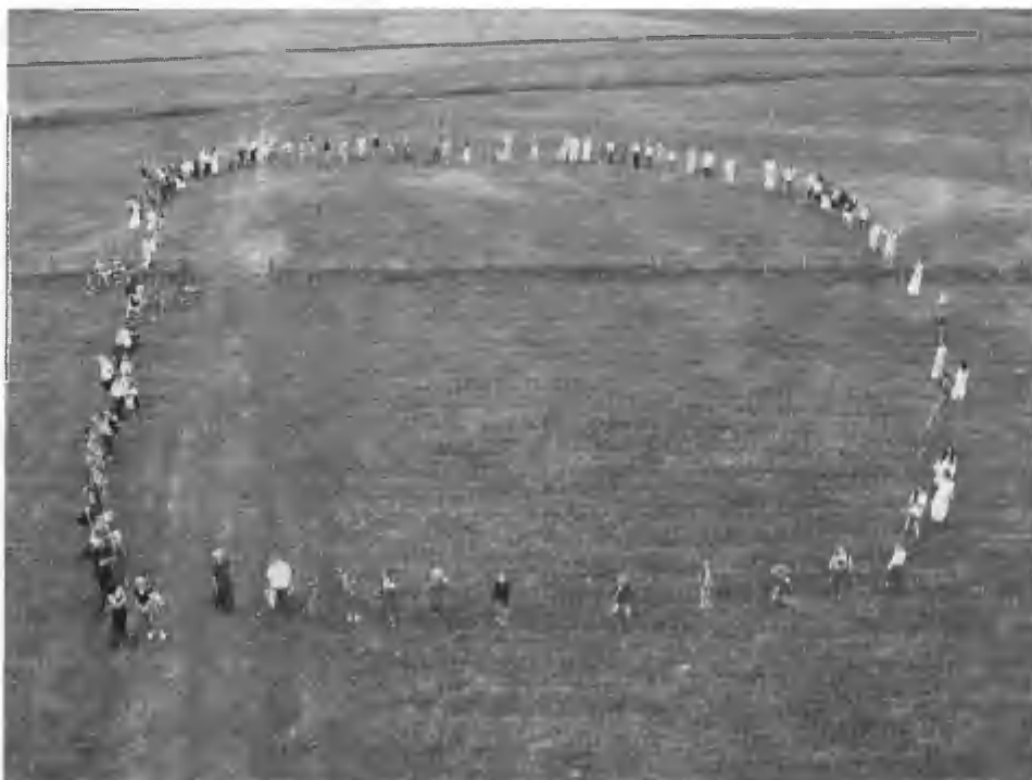
5. Uczestnicy festynu „Sobota na grodzisku” w 2005 r. tworzą krąg w miejscu grodu – siedziby księcia sławieńskiego

uczestników do miejsca imprezy (często lekko podmokła łąka), jak i wątpliwości służb konserwatorskich prowadziły do zmiany lokalizacji. Festyn kolejno wędrował z grodziska na łąkę Roberta Gofryka w Sławsku, by ostatecznie zadomowić się na boisku sportowym w Sławsku, niedaleko trochę młodszego grodziska.