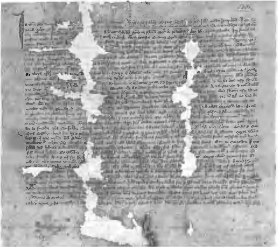
1. Bischöfliches Transumpt der Gründungsurkunde der Stadt Zanow vom 22. August 1348 / Biskupi transumpt aktu lokacyjnego miasta Sianowa z 22 sierpnia 1348 r., nadanego przez Piotra z Świąc z Polanowa; Landesarchiv Greifswald, Rep. 38U Zanow, Nr. 1

in Greifswald erhaltene urkundliche Überlieferung noch relativ bescheiden aus, so hat sich für Zanow ein ausgesprochen reicher Aktenbestand (von den Jahren 1777–1945) erhalten. Er befindet sich jedoch nicht im Landesarchiv Greifswald, sondern im Staatsarchiv in Stettin.