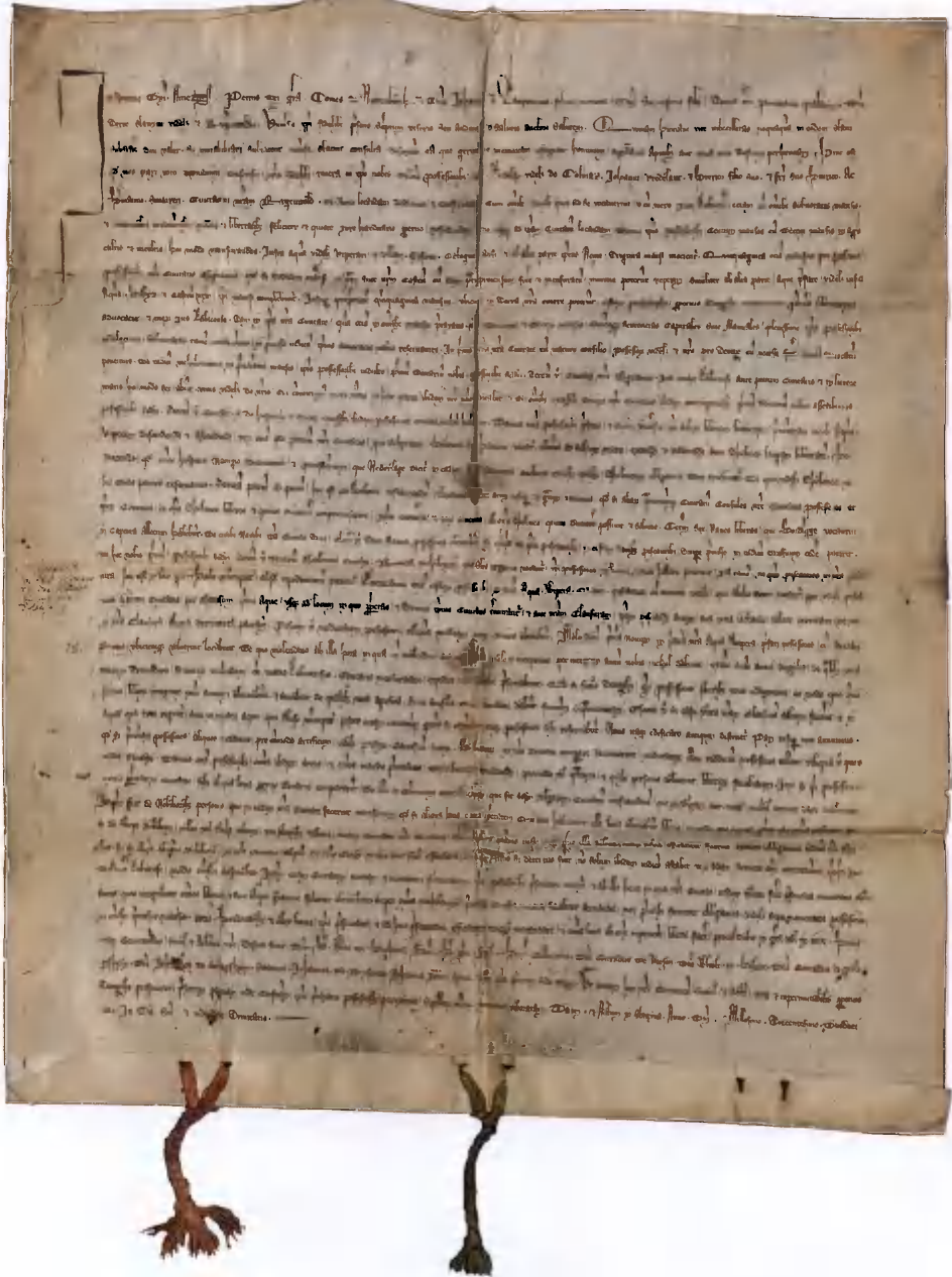
VIII. Gründungsurkunde der Stadt Rügenwalde vom 21. Mai 1312 / Akt lokacyjny miasta Darłowa z 21 maja 1312 r.; Landesarchiv Greifswald, Rep. 38U Rügenwalde, Nr. 1